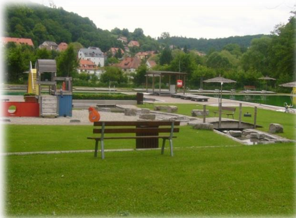
Naturbad Ebrach – Chemiefreies Wasser