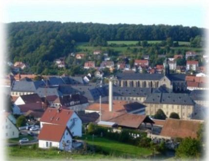
Ebrach / Baumwipfelpfad Ebrach

Ferienwohnung Sauerschell Neuburgstr. 9 96157 Ebrach/Großgessingen ☎09553/1511 ✉ roswitha.sauerschell@t-online.de www.steigerwald-fewosauerschell.de